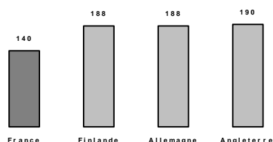
Nombre de jours de classes (la plupart des pays travaillant sur au moins 5 jours/semaine)

Les demi-journées d'information syndicales peuvent être récupérées sur le temps de la journée de solidarité ou des animations pédagogiques. Il suffit d'en informer l' IEN. Une attestation de présence sera délivrée lors de la réunion.